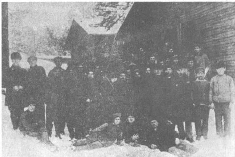
Κροστανθιανοί φυγάδες στη Φιλανδία.