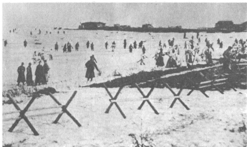
Μονάδες του Κόκκινου Στρατού διασχίζουν τον πάγο για να έπιτεθούν στην Κρονστάδη, τη νύχτα της 17 Μάρτη 1921.