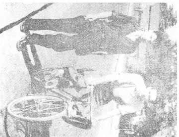
Xorri. Zuparnté kai 'Iraklivo. Xé. 1905.