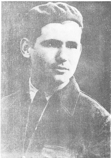
Φραντσίσκο Σαρρατέ 'Έλ Τοίκο, στο 1936