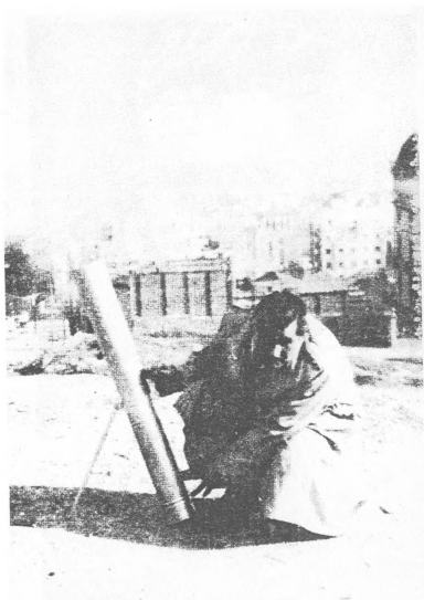
Σαμπατζι, Βασιλειώνη, 1956.