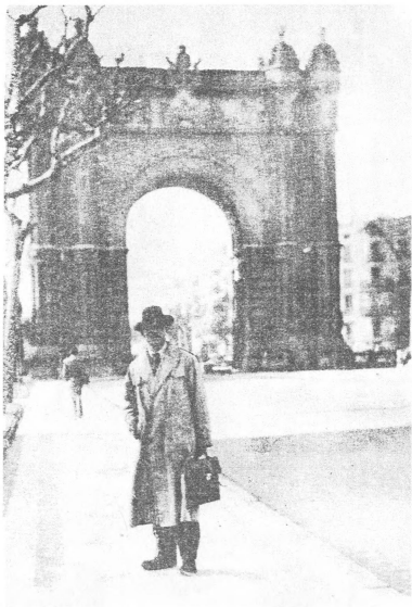
Σαμπάτε, Βαρκελώνη 1956