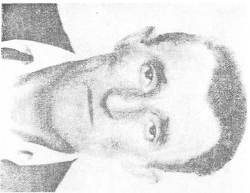
Francisco Ferrer. El Catala, antitorturador yud wd juf suu. Jh- ghet aric. 3. 'Lousion. 1940