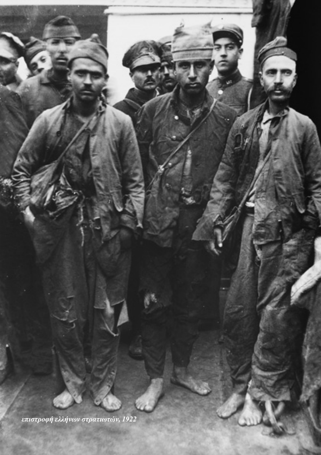
επιστροφή ελλήνων στρατιωτών, 1922