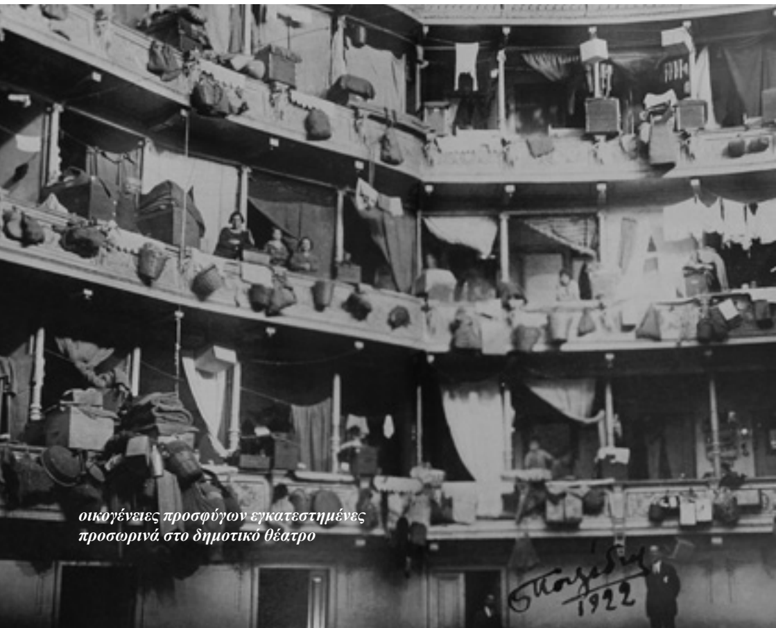
οικογένειες προσφύγων εγκατεστημένες προσωρινά στο δημοτικό θέατρο