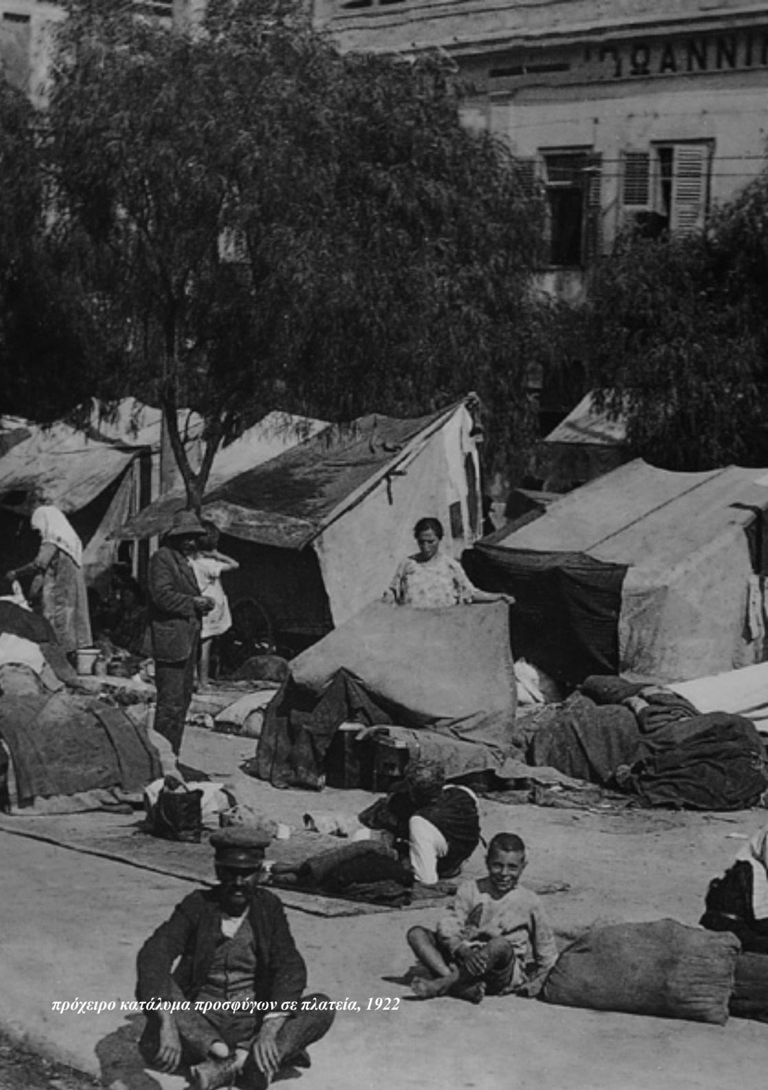
πρόχειρο κατάλυμα προσφύγων σε πλατεία, 1922