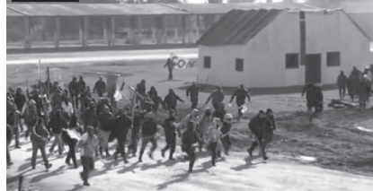
Στρατιωτική Άσκηση ΚΑΛΙΜΑΧΟΣ - www.kilkistoday.gr by kilkistodaygr