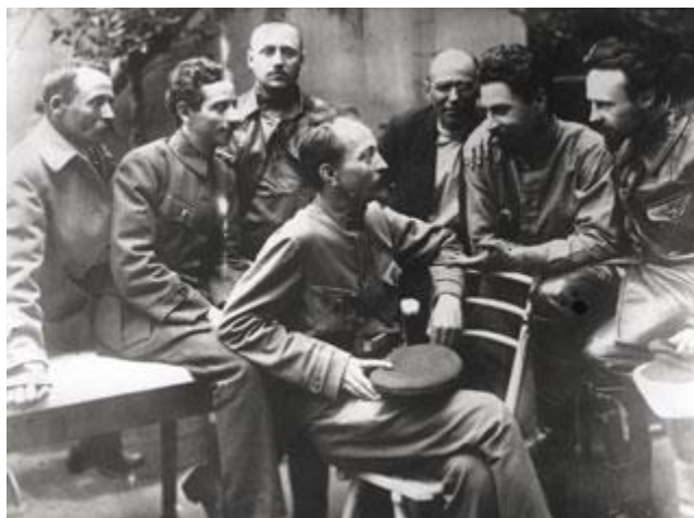
μέλη της Τσε-Κα 1

«Ναι, «δούλευε υπό πίεση»» συνέχισε, «υπό τις εντολές του Πήτερς, που ερχόταν από τη Μόσχα που και που. Η παρουσία του στην πόλη ήταν πάντα το σινιάλο για νέες συλλήψεις και εκτελέσεις. Καλά, μια μέρα οι Σοβιετικές εφημερίδες ανακοίνωσαν την άφιξη του Κόμη Πιρό, βραζιλιάνου πρεσβευτή. Εκείνο τον καιρό δούλευα στο Κινεζικό Προξενείο, που διοργάνωσε ένα γκαλά προς τιμή του Κόμη, και με την ευκαιρία τον γνώρισα. Έμεινα έκπληκτη όταν άκουσα τον βραζιλιάνο πρεσβευτή να μιλάει άπταιστα ρωσικά, αλλά μου εξήγησε ότι είχε ζήσει πολλά χρόνια στη χώρα πριν την Επανάσταση. Αναστέναξε για τις παλιές μέρες, και δεν έκρυψε ούτε μια στιγμή την εχθρικότητά του για το Μπολσεβικισμό και τις μεθόδους του.