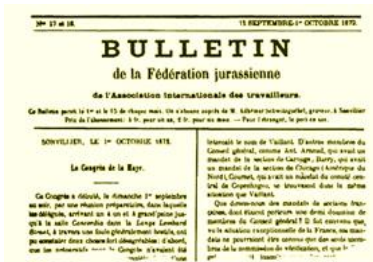
Το Δελτίο της «Ομοσπονδίας της Ιούρα»

Στην συνέχεια ο μόλις 26χρονος Καφιέρο προήδρευσε (με γραμματέα τον Αντρέα Κόστα, Andrea Costa, 1851 – 1910) στο Α συνέδριο του ιταλικού τμήματος της «Διεθνούς» που έγινε στο Ρίμινι (Rimini) στις 4 – 6 Αυγούστου 1872 και το οποίο τοποθετήθηκε παμφηφεί υπέρ του Μπακούνιν και της «Ομοσπονδίας της Ιούρα» («Federation jurassienne», που συσπείρωνε τους αναρχικούς της «Διεθνούς»), διακόπτοντας κάθε σχέση με τον «εξουσιαστικό γερμανικό κομμουνισμό» (όπως ορθά τον είχε χαρακτηρίσει ο ίδιος ο Μπακούνιν, προμαντεύοντας τον ολοκληρωτισμό των μαρξιστο-λενινιστικών καθεστώτων του 20ου αιώνα) του λονδρέζικου «Γενικού Συμβουλίου» της «Διεθνούς». Ο Μπακούνιν άλλωστε, απευθυνόμενος στους Ιταλούς εργάτες, είχε τοποθετηθεί με σαφήνεια υπέρ της υποχρέωσης να ενταχθούν σε οργανωμένη δράση ακόμα και εκείνοι που θέλουν να ορίζονται ως αναρχικοί: «εάν ο καθένας σας δρα μεμονωμένα και μόνο με την δική του πρωτοβουλία, σίγουρα όλοι σας θα παραμείνετε για πάντα ανίσχυροι. Αντίθετα, θα κάνετε ισχυρή την παρουσία σας όταν οργανωθείτε όλοι μαζί, ενώνοντας τις δυνάμεις σας, άσχετα με το πόσο ελάχιστες αυτές φαίνονται να είναι, όταν θα κάνετε επιτέλους μια αρχή πραγματικού αγώνα, μέσα σε μια και ενιαία συλλογική δράση, η οποία θα εμπνέεται από μία και ενιαία ιδέα, από έναν και ενιαίο στόχο, από μία και ενιαία θέση».