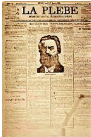
Η εφημερίδα «La Plebe»

Ο Καφιέρο, που μόλις είχε επιστρέψει από την Ρωσία, όπου είχε νυμφευθεί την επαναστάτρια Ολυμπία Κουτούζοφ (Olímpia Kutusov) για να της ανοίξει δρόμο για φυγή και εγκατάσταση στην Ελβετία, ενώ αρχικά τάχθηκε με το μέρος του Μπακούνιν, δήλωσε τελικά ότι θεωρεί τον εαυτό του εξαπατημένο και τον Μπακούνιν «φίλο των υλικών απολαύσεων», καθώς και ότι την υπόλοιπη περιουσία του θα την ξοδέψει όχι πια στο «La Baronata», αλλά για αγορά όπλων για την ποθούμενη επανάσταση στην Ιταλία (είχε ήδη αγοράσει 250 τουφέκια και περίστροφα). Τελικά, στις 25 Ιουλίου 1874 ο προσβεβλημένος Μπακούνιν, που αργότερα περιέγραψε εκείνες τις ημέρες σαν «μία πραγματική κόλαση», μεταβίβασε την ιδιοκτησία του αγροκτήματος στον Καφιέρο και έφυγε για την ύπαιθρο της Μπολόνια (Bologna), αποφασισμένος να πεθάνει στα οδοφράγματα (η εξέγερση που επιχείρησαν εκεί οι «μπακουνικοί» τον αμέσως επόμενο μήνα καταπνίγηκε εύκολα από τις αρχές μετά από προδοσία μάλιστα των ίδιων των χωριατών για το καλό των οποίων αγωνίζονταν οι επαναστάτες, όλοι οι αρχηγοί κλείστηκαν στις φυλακές και ο Μπακούνιν μόλις την τελευταία στιγμή κατόρθωσε να διαφύγει μεταμφιεσμένος σε ρωμαιοκαθολικό ιερέα, βλ. Drake, σελ. 35 – 36).