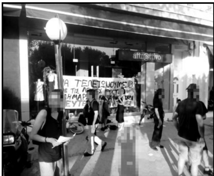
φωτογραφία από τον αποκλεισμό καταστημάτων και την πορεία που ακολούθησε