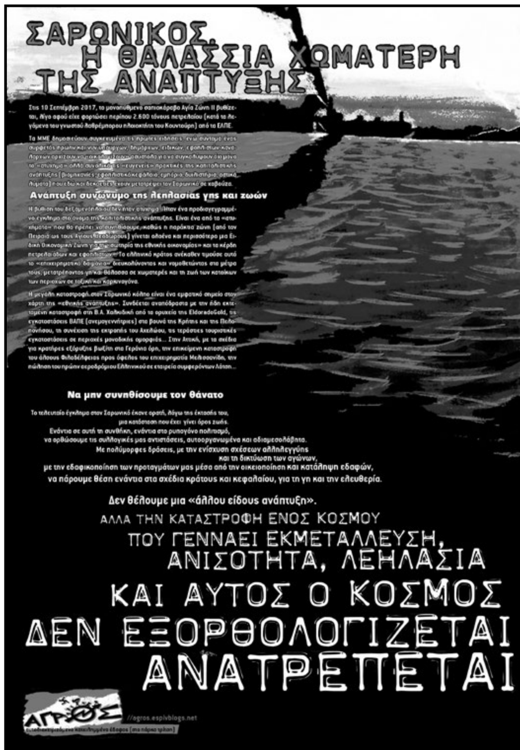
αφίσα από τον Αγρό που κολλήθηκε στις περιοχές μας

Αγρός - αυτοδιαχειριζόμενο κατειλημμένο έδαφος στο πάρκο τρίτων - http://agros.espivblogs.net