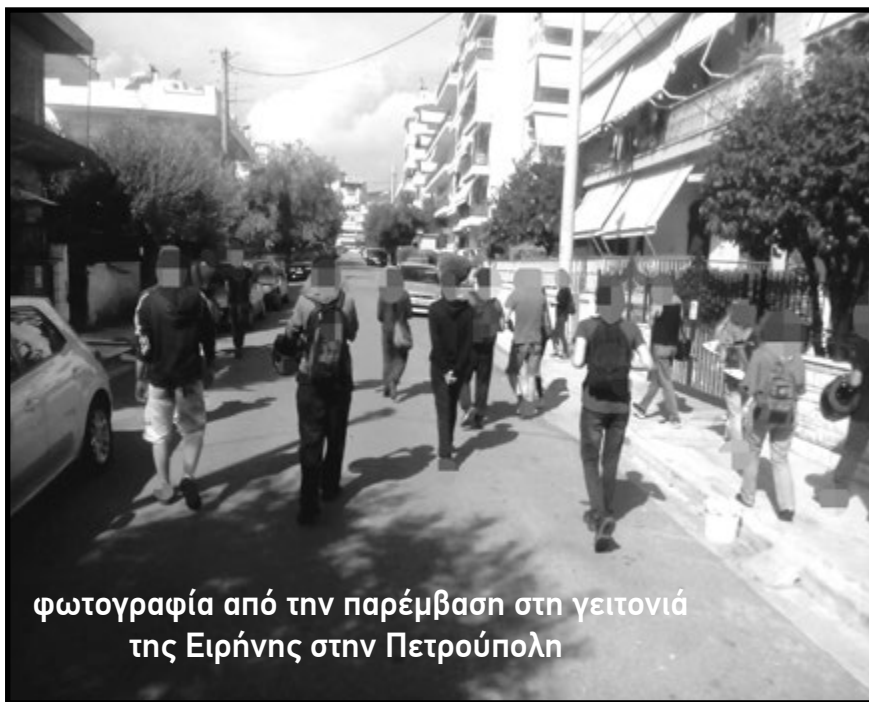
φωτογραφία από την παρέμβαση στη γειτονιά της Ειρήνης στην Πετρούπολη

[ολόκληρο το κείμενο της παρέμβασης «Για τη δολοφονία της Ειρήνης στην Πετρούπολη» στο site του Θεραίτη]