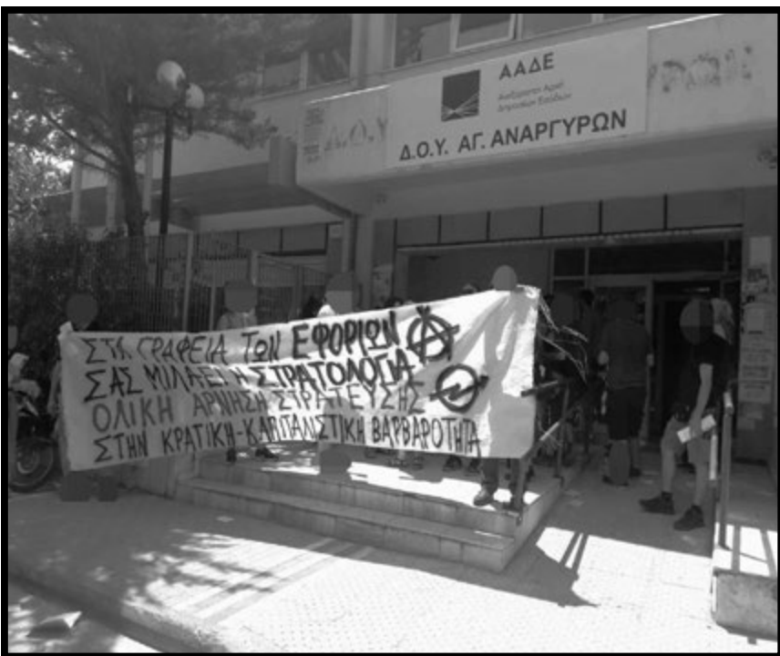
φωτογραφία από την παρέμβαση στη ΔΟΥ Αγίων Αναργύρων στις 10/7/2017

Μέσα ακριβώς σε αυτό το περιβάλλον επίτασης του εθνικισμού και του милитарισμού, καλλιέργειας κοινωνικού κλίματος διαρκούς πολεμικής προετοιμασίας , η ανυποταξία και όσοι εναντιώνονται με τις πράξεις τους