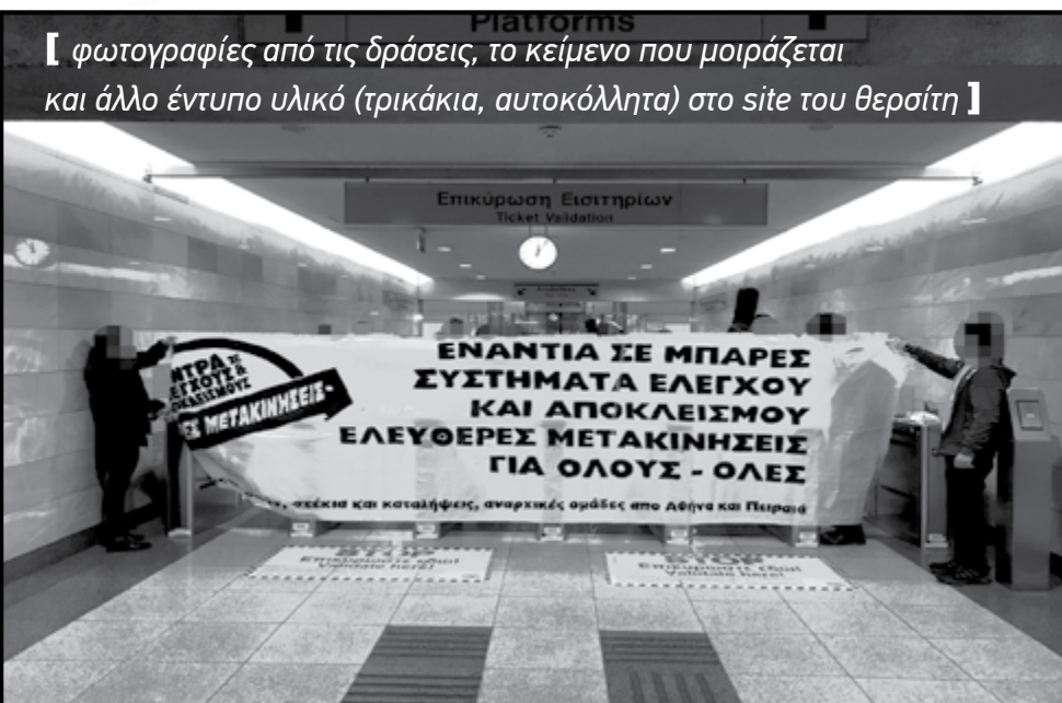
Φωτογραφίες από τις δράσεις, το κείμενο που μοιράζεται και άλλο έντυπο υλικό (τρικάκια, αυτοκόλλητα) στο site του Θεραίτη

από «Συνελεύσεις Γειτονιών, Στέκια, Καταλήψεις και Αναρχικές Ομάδες από την Αθήνα και τον Πειραιά για τις ελεύθερες μετακινήσεις»