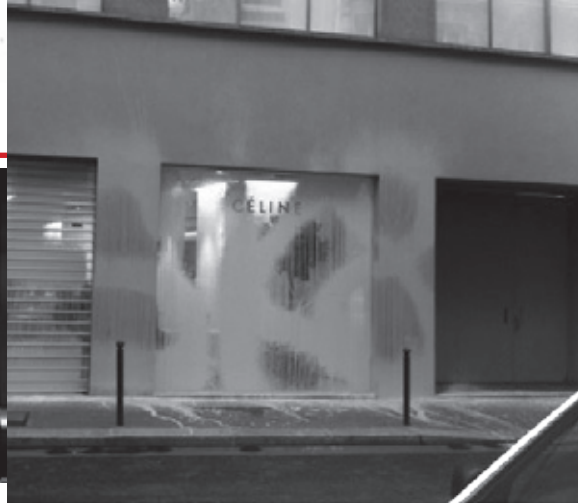
graffiti σε τοίχο καταστήματος στο κέντρο του Λονδίνου

Τα graffiti αρχικά εμφανίστηκαν στο μεξικό, στις αρχές του 20ου αιώνα, σαν ένας εύκολος τρόπος διάδοσης επαναστατικών μηνυμάτων σε όλους. Στην δεκαετία του '70 παίρνουν την μορφή που τα γνωρίζουμε σήμερα. Το '71, μετά από δημοσιοποίηση στην N.Y. Times μιας φωτογραφίας ενός τοίχου με το tag (υπογραφή) «TAKI 83» αρχίζει και εξαπλώνεται στις παρέες των νέων σαν νέα κουλτούρα που κατάφερε να σπάσει τόσο τα γεωγραφικά και τα κοινωνικά όρια της πόλης όσο και τα όρια των φυλετικών διακρίσεων. Στην Ελλάδα το graffiti κάνει την εμφάνιση του στα τέλη του '80 και συνδέεται πιο πολύ με την Hip- Hop μουσική ενώ από το '93 και μετά εξαπλώνεται και γίνεται ιδιαίτερα κατανοητό κοινωνικά.