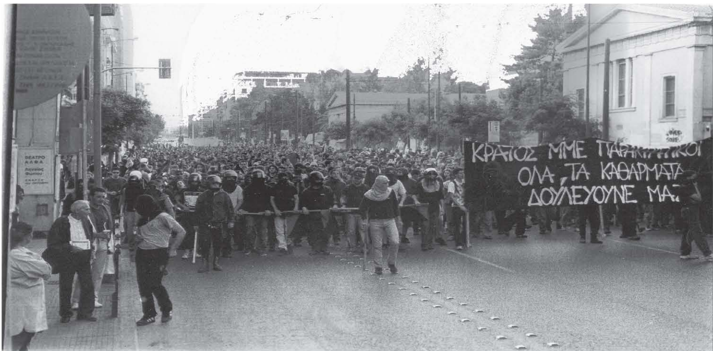
Από την αντιφασιστική πορεία στην Αθήνα στις 19/5/05

Μέσα στο καλοκαίρι κυκλοφορεί η είδηση γύρω από τις προθέσεις της Χρυσής Αυγής να διοργανώσει στη Ελλάδα πανευρωπαϊκό νεοναζιστικό camping με τον τίτλο «φεστιβάλ του μίσους». Στις 15.9.2005 πραγματοποιείται αντιφασιστική πορεία στη Πάτρα και δύο μέρες αργότερα στη Καλαμάτα. Την ίδια μέρα και ενώ το camping των νοσταλγών του Χίτλερ, του Μουσολίνι και των ταγματасφαλιτών έχει αναβληθεί υπό το βάρος των πιέσεων, οι νεοναζί της Χρυσής Αυγής μαζί με ελάχιστους ευρωπαίους ομοϊδεάτες τους θα κατασκοηνώσουν... στα γραφεία τους και στην οδό Γ Σεπτεμβρίου φρουρούμενοι από ισχυρές αστυνομικές δυνάμεις. Στη γύρω περιοχή, από την Ομόνοια ως το Πολυτεχνείο και τα Εξάρχεια, έχουν συγκεντρωθεί αναρχικοί, αυτόνομοι, αντιεξουσιαστές και αριστεριστές ακυρώνοντας στην πράξη την πρόθεση των νεοναζί να πορευτούν στο κέντρο της πόλης.