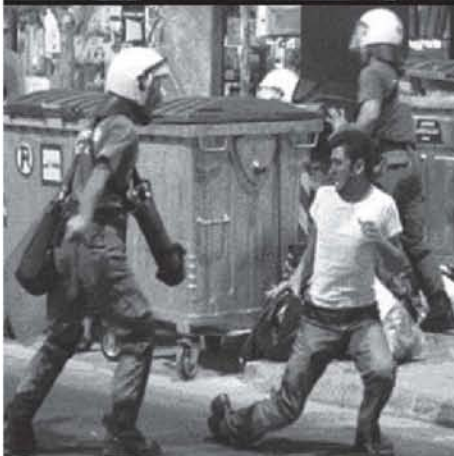
Το πανελλαδικό πογκρόμ εναντίον των Αλβανών στις 4/9/04, μετά τον ποδοσφαιρικό αγώνα Αλβανίας - Ελλάδα

Η κρυφή διαδικασία εθνικιστικής και ρατσιστικής μετάλλαξης δεν είχε πλέον κανένα λόγο να είναι τέτοια (κρυφή). Οι μάσκες είχαν πέσει και οι διαθέσεις είχαν φανεί: «Δεν θα μας κουνηθεί κανείς.»