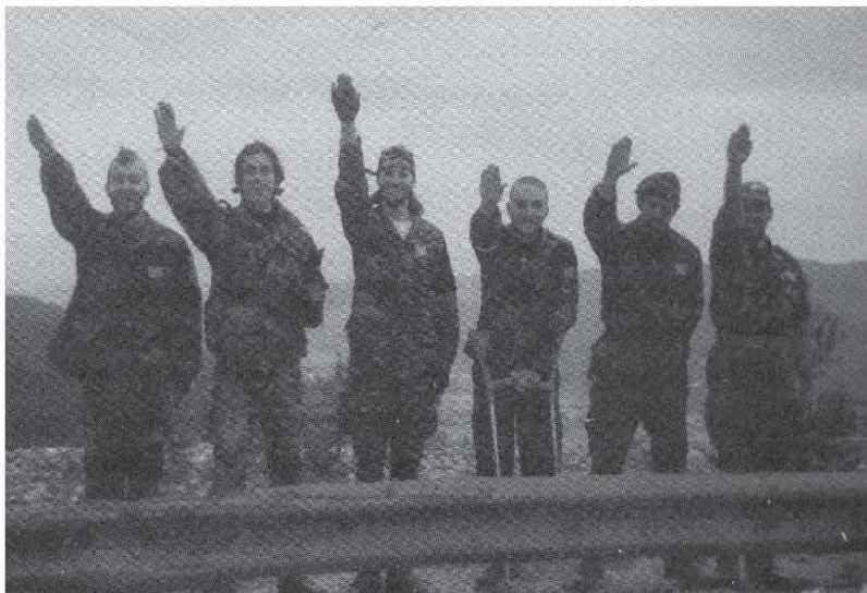
Πάνω: Οι έλληνες εθελοντές του σερβο-βοσνιακού μετώπου, χαιρετούν ναζιστικά και δεξιά: η αντιπετώπιση που είχαν από τα μμε στην πατρίδα...