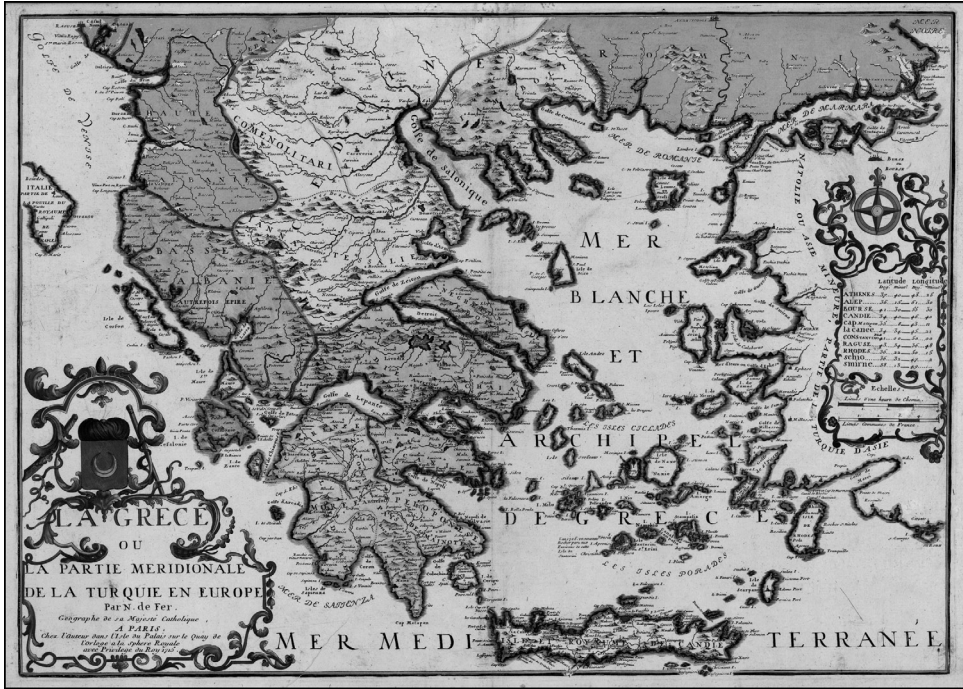
Χάρτης 10. Χάρτης του 1715 που δείχνει την οθωμανική Μακεδονία.