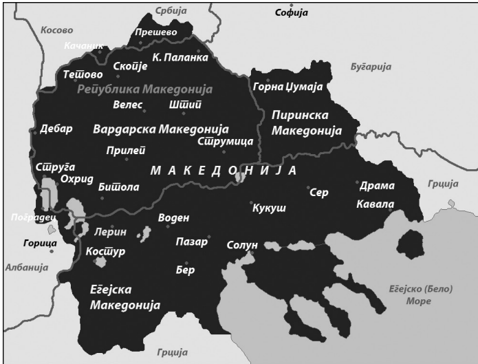
Χάρτης 11. Η Μακεδονία κατά το μακεδονικό εθνικιστικό όραμα.

Οστόσο, καθ' όλη τη διάρκεια αυτής της περιόδου ο εθνικισμός απέναντι στην Ελλάδα και ο εθνικισμός γενικότερα σαφώς και υπήρχε 57 . Η περίοδος σηματοδεύτηκε από τη σοβαρή ένταση ανάμεσα στους Μακεδόνες και τους Αλβανούς που ζουν στη Δημοκρατία της Μακεδονίας. Επιπλέον, τα δεξιά κόμματα, που ήταν τότε στην αντιπολίτευση, είχαν υιοθετήσει μια καθαρά ανθελληνική ρητορική 58 . Εν τω μεταξύ, οι άνθρωποι ήταν (και ακόμα είναι) εκτεθειμένοι στην επίσημη ιστοριογραφία που παρήγαγε (και εξακολουθεί να παράγει) εθνικιστικά στερεότυπα και αισθήματα μίσους έναντι των γειτονικών λαών. Χαρακτηριστικό παράδειγμα αποτελεί ο χάρτης ολόκληρης