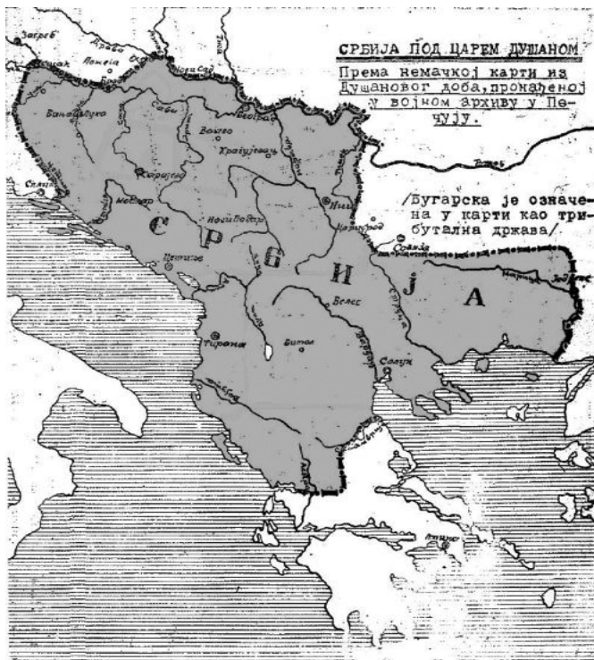
Χάρτης 3. Ένα από τα εθνικιστικά οράματα της "Μεγάλης Σερβίας" βασισμένο στη Σερβία του Στέφανου Δουσάν το 1355 μ.Χ.