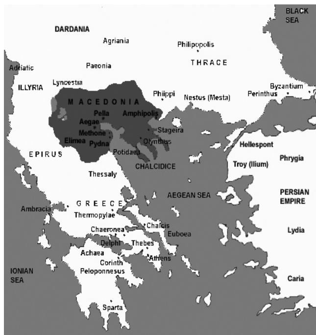
Χάρτης 4. Η Μακεδονία κατά τη βασιλεία του Φιλίππου Β΄.

ανεξάρτητες Ελληνικές πόλεις στην παράκτια ζώνη της Χαλκιδικής. Είναι ενδιαφέρον ότι μέχρι αυτό το χρονικό σημείο, τα κατεκτημένα εδάφη αποτέλεσαν συστατικό στοιχείο της εδαφικής επικράτειας της αρχαίας Μακεδονίας. Οι μετέπειτα κατακτήσεις του Φιλίππου όμως, τόσο σε περιοχές που υπήρχαν ελληνικές πόλεις-κράτη, όσο