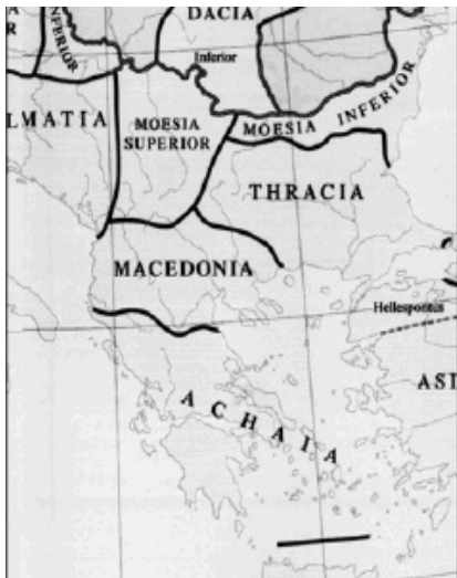
Χάρτης 5. Οι ρωμαϊκές επαρχίες της βαλκανικής χερσονήσου τον 3 ο αιώνα μ.Χ. (Barrington Atlas 2000, χ.100)