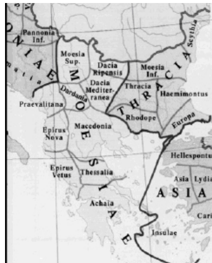
Χάρτης 6. Οι ρωμαϊκές επαρχίες της Διοίκησης Μοισιών σύμφωνα με τον "Κατάλογο της Βερόνα" ("Laterculus Veronensis" 303-324 μ.Χ.) (Barrington Atlas 2000, χ.101)