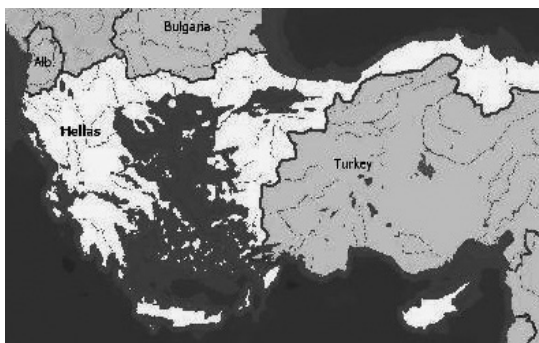
Χάρτης 1. Η Ελλάδα της "Μεγάλης Ιδέας"

Η Ελλάδα, η Βουλγαρία και η Σερβία διεκδικούσαν όσο το δυνατό περισσότερο από τις οθωμανικές κτήσεις στα Βαλκάνια, μολοντί ενίοτε έδειξαν ότι υποστήριζαν την ιδέα της μακεδονικής ενότητας. Καθώς ο πόλεμος των λέξεων πέρασε σταδιακά στον ένοπλο αγώνα των αντάρτικων συμμοριών, μια άλλη απάντηση στις εξωτερικές πιέσεις ήταν το μακεδονικό αυτονομιστικό κίνημα που άρχισε να υποστηρίζει την προσπάθεια χειραφέτησης του ντόπιου πληθυσμού. Προήλθε από τους νέους αστούς διανοούμενους που επηρεάστηκαν από τη σερβική και βουλγαρική εθνική χειραφέτηση. Με την έμφαση που έδινε στην κοινωνική ισότητα, κατάφερε να προσελκύσει τελικά αγρότες που αντιδρούσαν στις καταχρήσεις των μεγαλοαγοκτημόνων και των αρχών, αλλά και στα διασταυρούμενα πυρά των εθνικιστών.