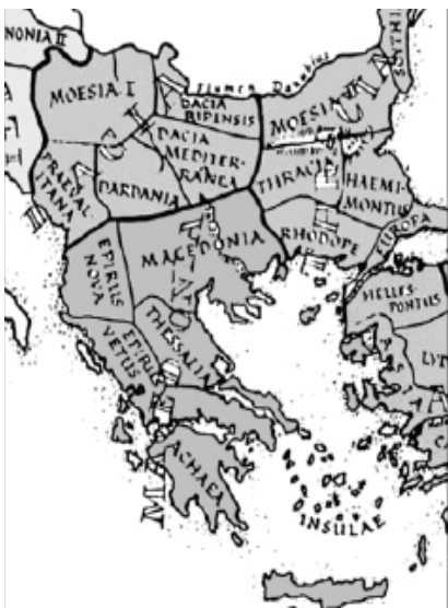
Χάρτης 7. Οι ρωμαϊκές επαρχίες της Διοίκησης Μακεδονίας τον 5 ο αιώνα μ.Χ. σύμφωνα με τη "Notitia Dignitatum" (Jones 1964, χ.III)