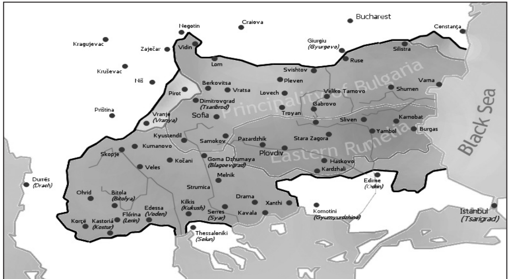
Χάρτης 2. Η "Μεγάλη Βουλγαρία" κατά τη συνθήκη του Αγίου Στεφάνου το 1878 μ.Χ.