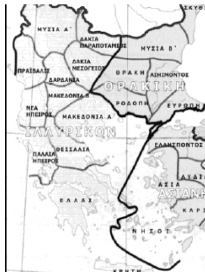
Χάρτης 8. Οι ρωμαϊκές επαρχίες της Διοίκησης Ιλλυρικού τον 6 ο αιώνα μ.Χ. σύμφωνα με τον "Synecdemus Ierocleus" (Δρακούλης 2009, 7, χ. Γ.1.δ)