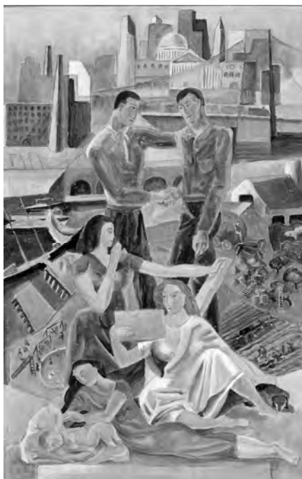
Marguerite Zorach (1887-1968), Commerce and industry