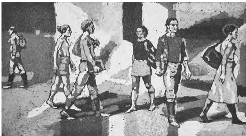
Isabel Bishop (1902-1988), Students outdoors