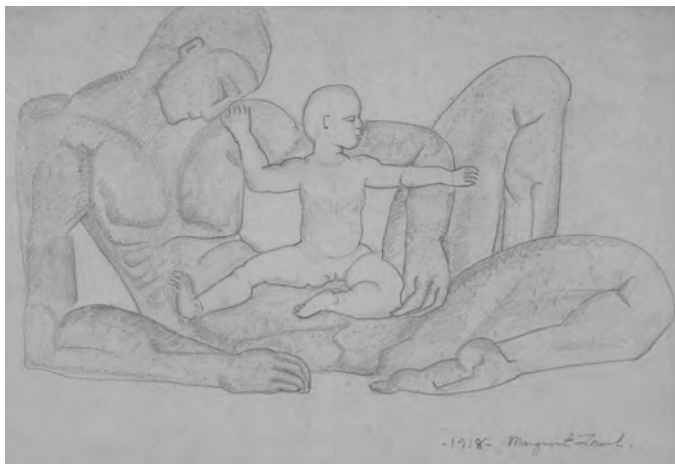
Marguerite Zorach (1887-1968), Father and daughter