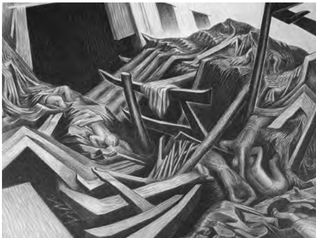
Wanda Gág (1893-1946), In the year of our lord