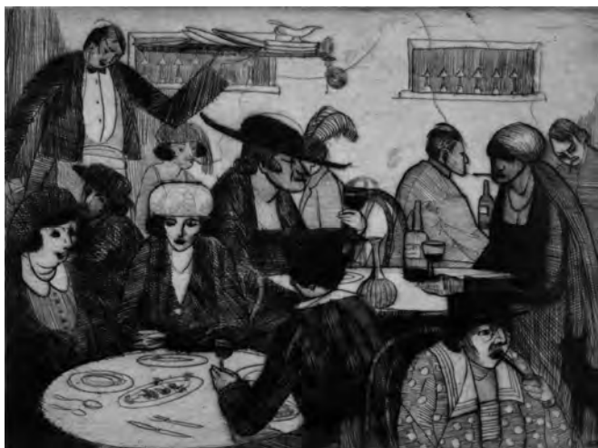
Peggy Bacon (1895-1987), Mazzonis