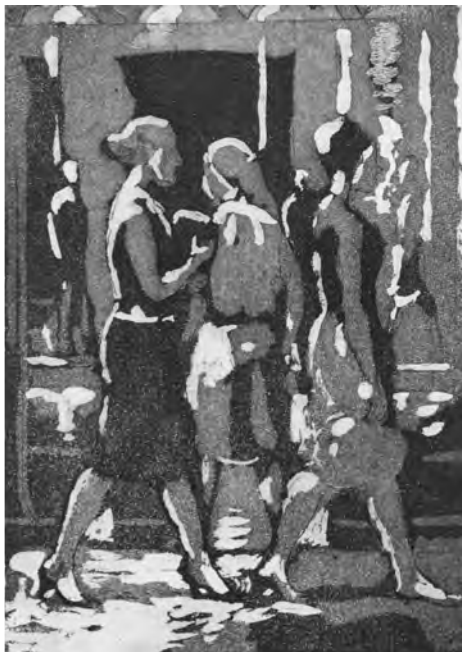
Isabel Bishop (1902-1988), Woman walking