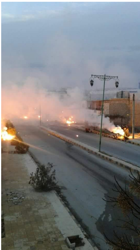
Επιθέσεις λευκού φωσφόρου από το καθεστώς σε δρόμους του Χαλεπίου

Η δημιουργία παράνομων δομών, η απόκτηση οπλισμού, πληροφοριών κλπ. εκ των προτέρων μας προετοιμάζει υλικά και ψυχολογικά να υπερασπίσουμε σε πρώτη φάση τις κοινότητές μας και μετέπειτα να δημιουργήσουμε μία πηγή έμπνευσης, έτσι ώστε και άλλοι να απαλλοτριώσουν και να χρησιμοποιήσουν τα όπλα του εχθρού, για τη γενικευμένη αυτοοργάνωση της καθημερινότητας.