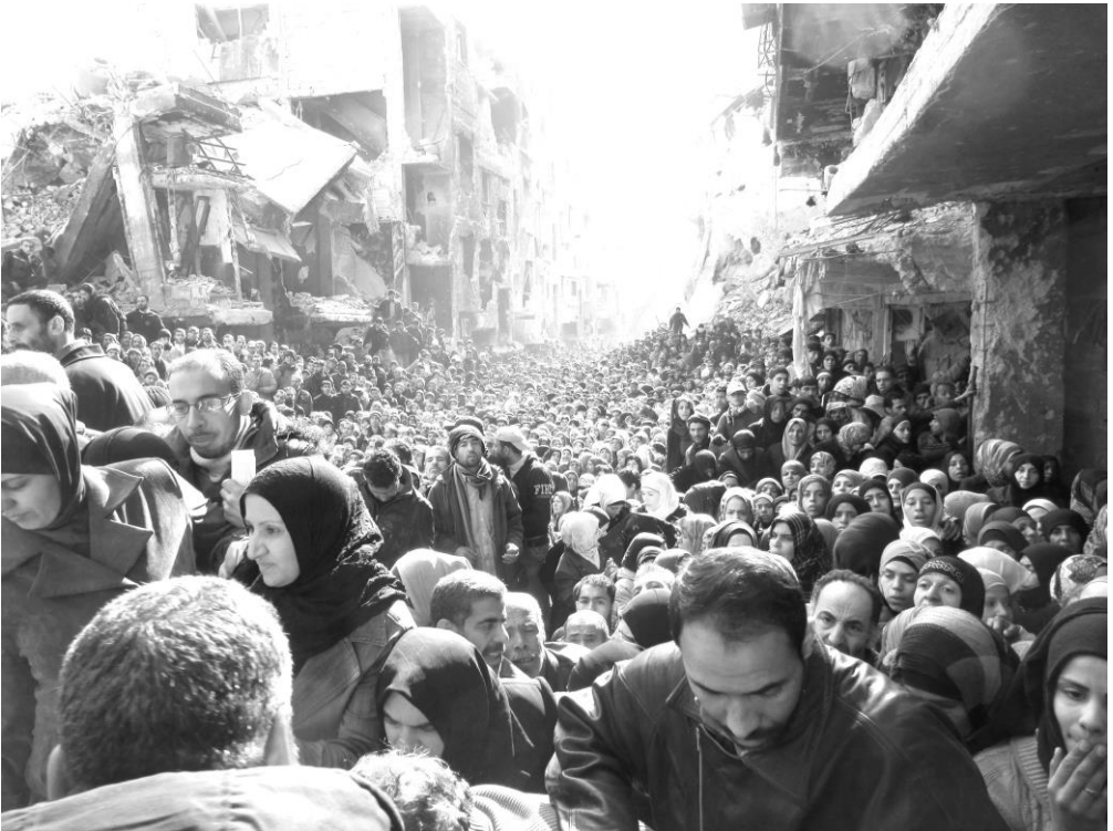
Γιαρμούκ μετά από βομβαρδισμούς του Άσαντ

Σημαντικός παράγοντας ανακοπής της επαναστατικής ορμής και έδαφος για την εισχώρηση των ισλαμιστών, ήταν η επακόλουθη ηττοπάθεια του κόσμου μετά την μη πτώση του Άσαντ και αντίστοιχα της κατακόρυφης αύξησης της βίας από μεριάς του. Όπως είπαμε και πριν, οι Σύριοι, λόγω της αιγυπτιακής και तुνησιακής εμπειρίας, ίσως θεωρούσαν πως, παρά την καταστολή, οι μέρες του Άσαντ είναι μετρημένες. Όταν αυτό, για λόγους που εξηγούμε στη συνέχεια δεν συνέβη, προκάλεσε αρνητικά συναισθήματα και έβγαλε στην επιφάνεια μίση δεκαετιών. Ο κόσμος είτε άρχισε να αποτραβιέται από επαναστατικά εγχειρήματα και να εγκαταλείπει μαζικά τη χώρα, είτε επιζητούσε διάφορους σωτήρες να τον τραβήξουν από τον βούρκο. Για άλλη μία φορά η έλλειψη οργανωμένης πολιτικής αντιπρότασης στη διαφαινόμενη ισχυροποίηση του Άσαντ έδρασε καταλυτικά στην εξέλιξη των πραγμάτων.