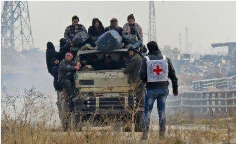
Από την εκκένωση του Χαλεπίου, Δεκέμβρης '16

πληθυσμού. Η δομική ανάγκη του συστήματος για αυξανόμενους ρυθμούς κερδοφορίας ανατροφοδοτεί τον φαύλο κύκλο της υπερκατανάλωσης και της υπερπαραγωγής. Κανείς, μέχρι στιγμής τουλάχιστον, δεν μπορεί να προβλέψει το μέλλον, αν όμως δεν πετύχουμε την καταστροφή της υπάρχουσας κοινωνικοπολιτικής και οικονομικής οργάνωσης, το πιο πιθανό είναι ότι το χρώμα του θα είναι αυτό του αίματος αναμειγμένου με στάχτες.