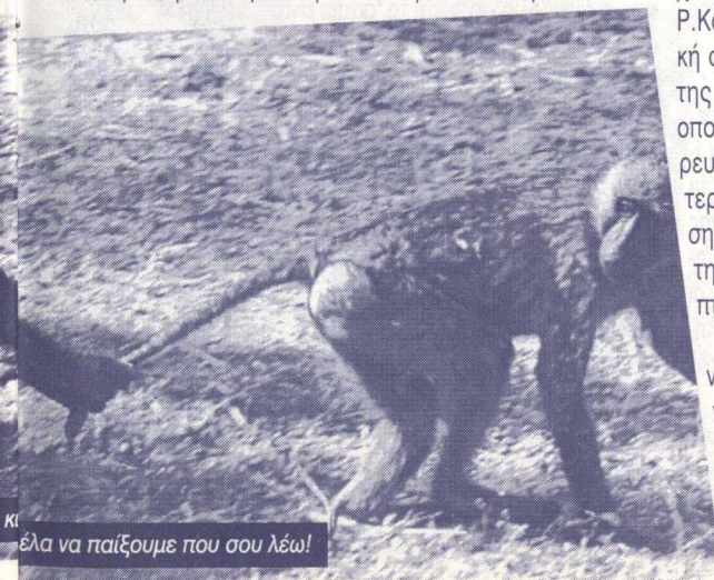
Κι έλα να παίξουμε που σου λέω!

Με ή χωρίς ένα στρατιωτικό πόλεμο τα ελληνικά αφεντικά θα συνεχίσουν να επεκτείνονται καταλαμβάνοντας νέες αγορές, νέους πληθυσμούς (εργάτες), νέα κράτη (οικονομίες), εκτός αν οι ήδη κατακτημένοι στο σώμα και στο μυαλό υπηκόοί τους, γίνουν αντίπαλοί τους σ' αυτόν τον πόλεμο.