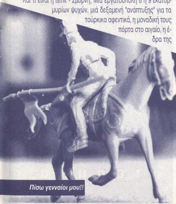
Πίσω γενναίοι μου!!

Με τόσες συμφωνίες, με τόσες αποδοχές, με τόσες πειθαρχίες και τόσες συντριβές στο εσωτερικό του κράτους, το ενδεχόμενο ενός ελληνοτουρκικού πολέμου πρέπει να ειπωθεί στην ωμή του πραγματικότητα: επειδή ένας τέτοιος πόλεμος δεν είναι "φυσικό φαινό-