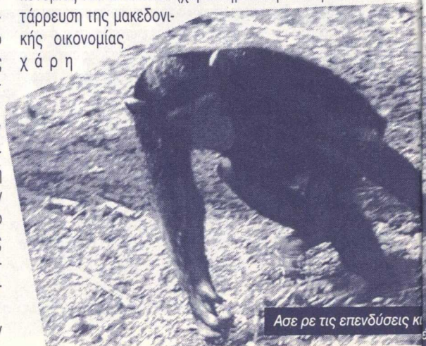
Άσε ρε τις επενδύσεις κι

πόλεμος κι αυτός, όχι μόνο γιατί το αποτέλεσμα του είναι η, σε μεγαλύτερο ή μικρότερο βαθμό, κατάκτηση της οικονομίας του αντιπάλου (χαρακτηριστική είναι η κατάρρευση της μακεδονικής οικονομίας χά ρ η