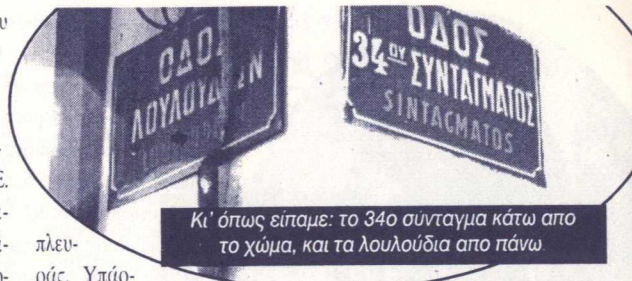
Κι' όπως είπαμε: το 34ο σύνταγμα κάτω από το χύμα, και τα λουλούδια από πάνω

Αφού εδραιώνεται για τα καλά η ελληνική στρατιωτική παρουσία στην κύπρο με το ενιαίο αμυντικό δόγμα (το οποίο "απομακρύνει τη δυνατότητα έναρξης διαλόγου Κληρίδη - Ντενκτάς", ΝΕΑ 18/12/96) μένουν ακόμα να "καμφθούν" οι ενδοιασμοί της Ε.Ε. στο θέμα της ένταξης της νότιας κύπρου σαν μοναδικού και απόλυτου κληρονόμου της κυπριακής δημοκρατίας των συμφωνιών της Ζυρίχης και του Λονδίνου. Κατά την επίσκεψη Σημίτη στην κύπρο (1/10/96) αποφασίζεται να πραγματοποιηθούν εικονικές προσπάθειες για πρόοδο του διακοινοτικού διαλόγου τους επόμενες μήνες, θέλοντας να φανεί έργο-χωρίς-αποτέλεσμα-εξαιτίας-της-αδιαλλαξίας-της-άλλης-