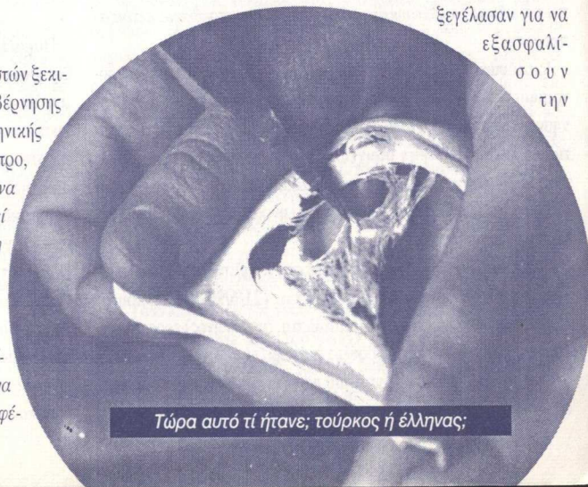
Τώρα αυτό τί ήτανε; τούρκος ή έλληνας;