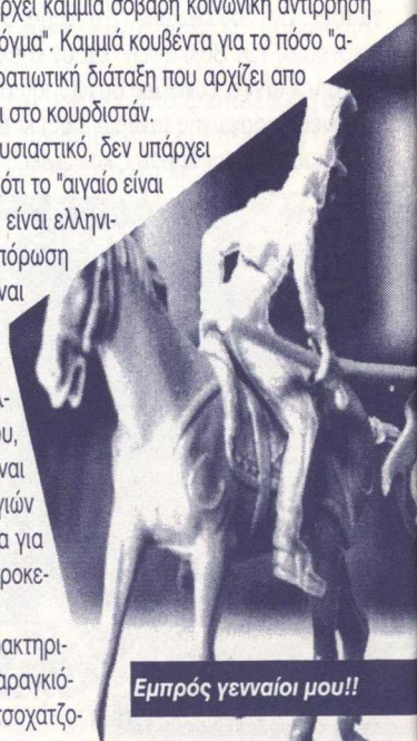
Εμπρός γενναίοι μου!!

Τρίτο και μάλλον χαρακτηριστικό: όταν ένας (έστω καραγκιόζης) υπουργός άμυνας τσοχατζο-