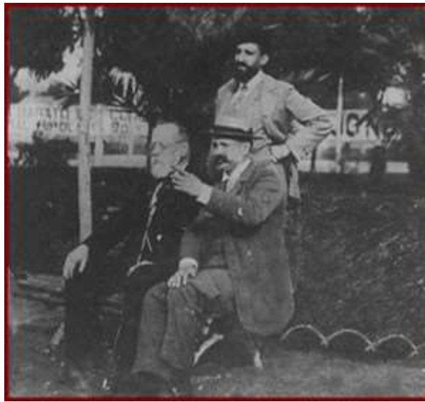
Ο Anselmo Lorenzo μαζί με τον Francisco Ferrer

Ο Lorenzo συνελήφθη πολλές φορές και η FRE περνάει στην παρανομία. Το 1873 έμεινε στο Παρίσι και ύστερα εγκαταστάθηκε στην Βαρκελώνη, όπου συμμετείχε στον τομέα των τυπογράφων της FRE. Το 1885 συμμετείχε στο περιοδικό "Acratia" στη Βαρκελώνη και από το 1887 ως το 1893 στην εφημερίδα El Productor. Το 1895 δημιούργησε το περιοδικό "Ciencia Social" (Κοινωνική Επιστήμη). Τη νύχτα μεταξύ 28 και 29 Ιούλη του 1896 συνελήφθη για την επίθεση στο Campios-Nuevos 1 και φυλακίστηκε με πολλούς συντρόφους και συντρόφισσες που βασανίστηκαν και εκτελέστηκαν στη φυλακή Μονχιούχ. Αποφυλακίστηκε μετά από 7 μήνες στην κόλαση του Μονχιούχ και αυτοεξορίστηκε στην Γαλλία, όπου συνάντησε τους Malato, Grave, Faure, and Ferrer.