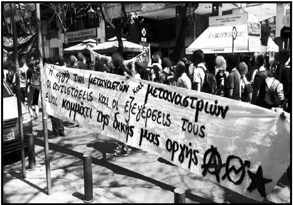
από την πορεία στις 14/04/2018