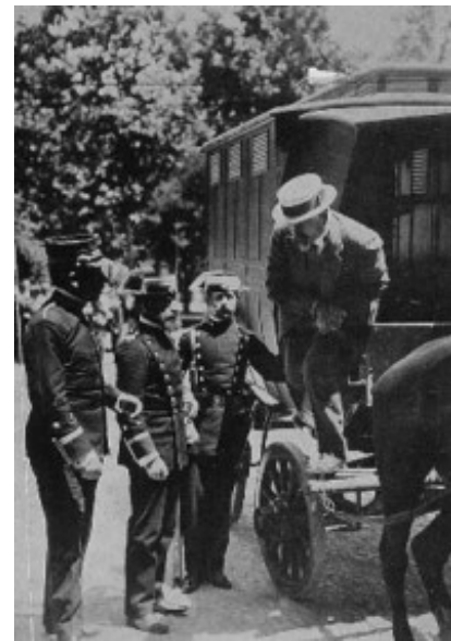
Ο Φερρέρ στα χέρια της αστυνομίας