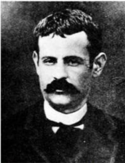
Santiago Salvador Franch

Autor de l'atemptat de Liceu el 7-11-1893