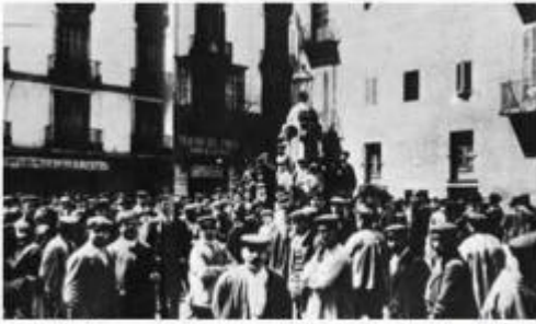
Sindicalistes sortint d'un miting del Teatro Circo Barcelonés als primers 90's del segle XIX, un dels molts d'aquella època.