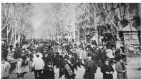
Les Rambles de Barcelona el 1890, lloc habitual de manifestacions i incidents entre els sindicalistes i la policia

1r maig 1890 a la plaça Catalunya de Barcelona