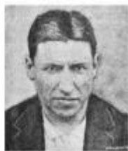
Antoni Nogués i Figueras