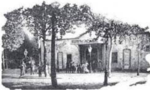
Entrada del teatre Calvo-Vico als primers anys 90 del segle XX