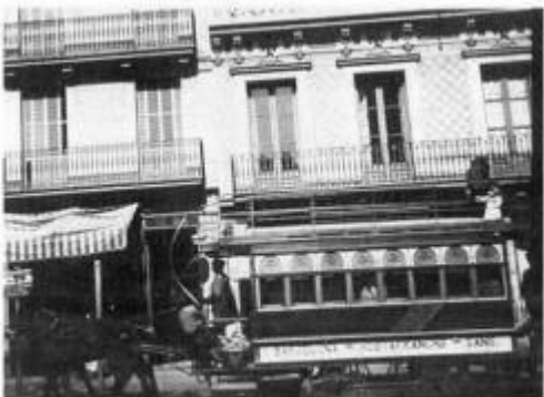
El carrer de Sants al voltant de 1891, amb uns dels típics tramvies de l'època arrossegats per cavalls.