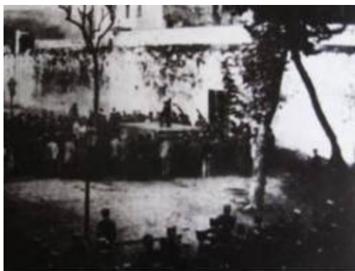
Execució al garrot vil de Santiago Salvador el 21-11-1894