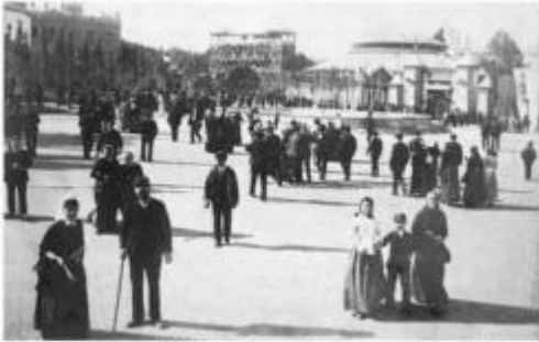
La plaça Catalunya el 1888, en el passeig que anava en diagonal des de les Rambles al Passeig de Gràcia amb el Circ Equestre a la dreta. lloc habitual tant de passejades com de concentracions obreres.