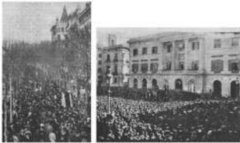
Manifestació per Barcelona fins a l'ajuntament el 13-2-1898, per demanar la revisió del Procés de Montjuïc.

Manifestació per la revisió del procés (1898)