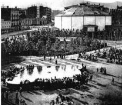
La plaça Catalunya de Barcelona l'1 de maig de 1890 ocupada per policies amb cavalls

1r maig 1890 a la plaça Catalunya de Barcelona