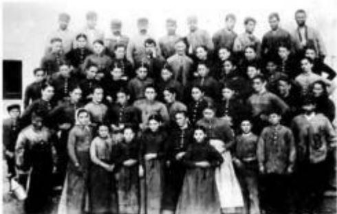
Treballadors i treballadores de la fàbrica tèxtil Viladomiu el 1889. Com es veu hi havia nens i nenes entre els treballadors, cosa habitual a l'època.