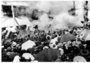
Moment en que esclata la bomba llençada per Mateu Morral contra la carrossa del rei el 31-5-1906