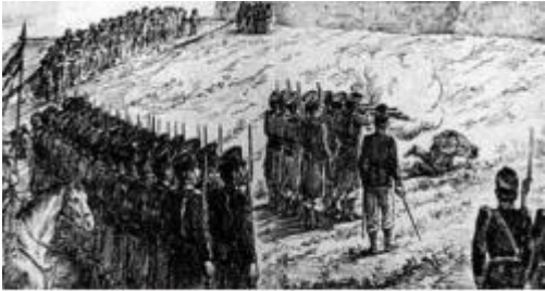
Il·lustració sobre l'execució de Paulí Pallàs