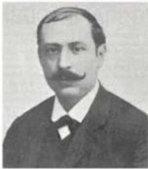
Ramon Sempau i Barril

Autor de l'atemptat contra el tinent Narciso Portas el 4-9-1897