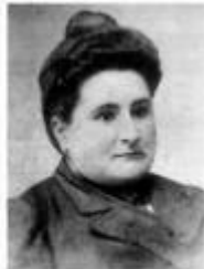
Teresa Mañé i Miravet

Fundadors de la publicació anarquista "La Revista Blanca" el 1898