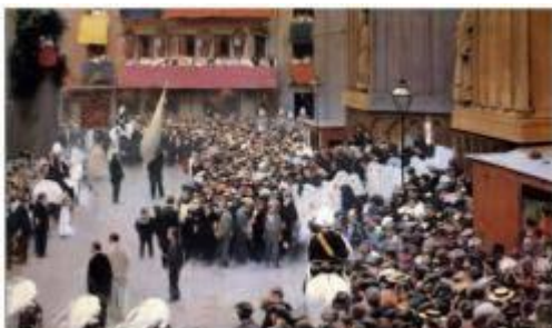
Pinzell sobre la sortida de la Processó del Corpus de Santa Mª del Mar el 7-6-1896