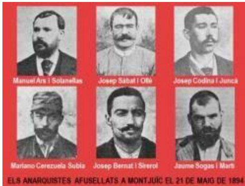
Anarquistes afusellats a Montjuïc l'any 1894