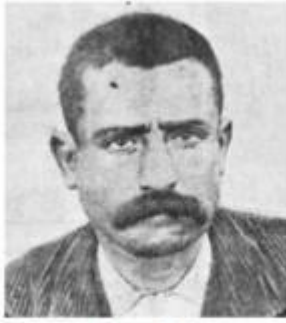
Ramon Murull i Comas

Autor de l'atemptat contra el governador Larroca el 25-1-1894