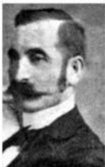
Ferran Tarrida del Màrmol

Un dels impulsors de l'anarquisme sense adjectius