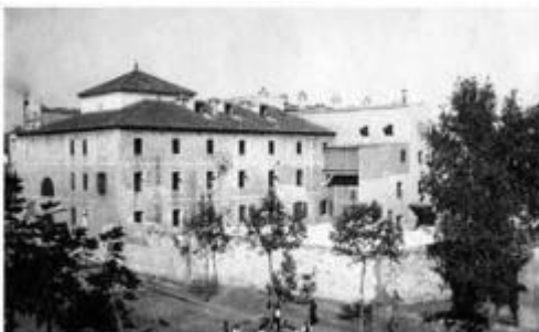
Presó del carrer Reina Amàlia de Barcelona als anys 90 del segle XIX Presó del carrer Reina Amàlia