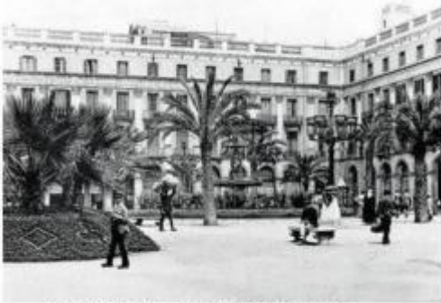
Plaça Reial de Barcelona als voltants de 1892. Plaça Reial de Barcelona 1892