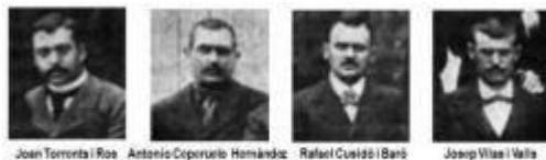
Alguns detinguts i principals acusats per l'atemptat de Canvis Nous de 1896. (Fotos de l'any 1900)