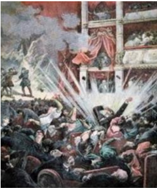
Gravat de l'atemptat del Liceu