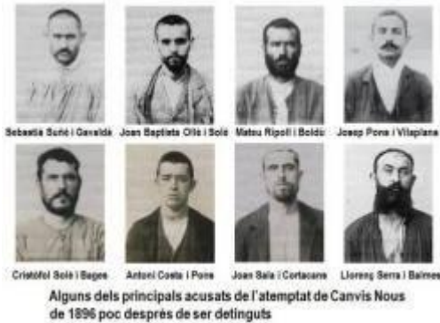
Acusats carrer Canvis Nous