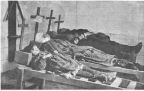
Alguns dels morts per l'atemptat del carrer Canvis Nous