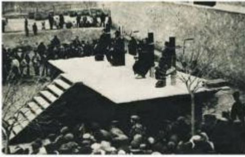
Execució dels 4 anarquistes a Jerez de la Frontera el 10-2-1892 Execucions Jerez de la Frontera