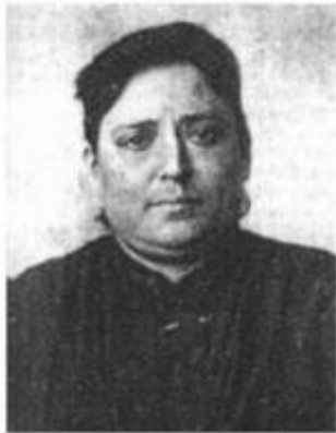
Teresa Claramunt i Creus