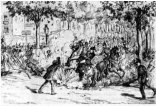
Il·lustració que mostra com es va produir l'atemptat de Paulí Pallàs