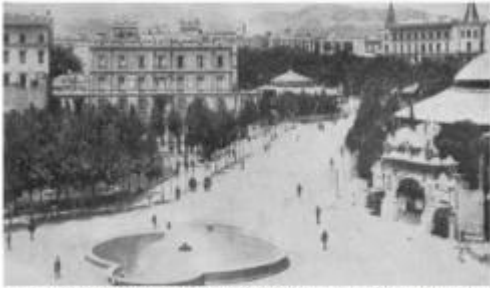
A la dreta el Circ Equestre el 1891, lloc d'habituals mitings, situat en el passeig que travessava la Plaça Catalunya des de les Rambles fins al Passeig de Gràcia