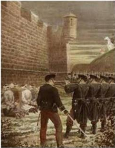
Gravat sobre l'afusellament dels 5 anarquistes a Montjuïc el 4-5-1897