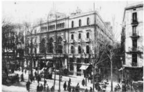
El Liceu de Barcelona a principis dels anys 90 del segle XIX