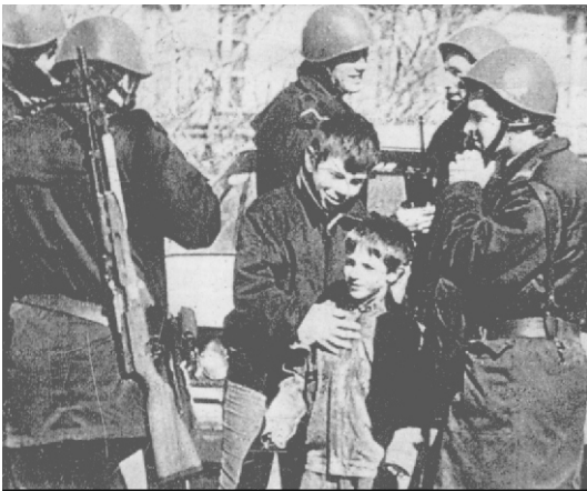
1989, κόσοβο. Στρατιωτικός νόμος

Στην ηγεσία των αλβανών του κοσόβου βρίσκεται ο μετριοπαθής Ιμπραήμ Ρουγκόβα. Σε αυτόν και στην πολιτική που ακολούθησε οφείλεται, μετά την πρώτη φάση της κατάργησης της αυτονομίας του κοσόβου, το ότι το κόσοβο δεν πήρε μέρος στον σερβοκρατοβοσνιακό πόλεμο, αφού ήταν θιασώτης μιας παθητικής-άοπλης αντίστασης. Βέβαια εδώ πρέπει να σημειώσουμε ότι στη διαμόρφωση μιας τέτοιας πολιτικής βοήθησε αρκετά και το γεγονός ότι τότε ακόμη δεν τους είχε "υιοθετήσει" κανένας. Μετά την υπογραφή όμως της συμφωνίας του Dayton, το καθεστώς Μιλόσεβιτς αρχίζει να κάνει και εδώ ό,τι και στη Βοσνία, να εφαρμόζει δηλαδή την πολιτική των εθνικών εκκαθαρίσεων. Τα καψίματα των χωριών και οι πρώτες δολοφονίες των αμάχων δημιουργούν και τα πρώτα καρβάνια των προσφύγων. Δημιουργούν όμως επίσης και μια ριζοσπαστική αντιπολίτευση στον Ρουγκόβα, η οποία μπορεί να είναι μειοψηφική, αλλά όσο εντείνεται η πολιτική των εθνικών εκκαθαρίσεων τόσο πιο πολύ αποκτά κοινωνικά ερείσματα στο κόσοβο και τόσο πιο πολύ ριζοσπαστικοποιείται. Όχι με την έννοια ότι προβάλλει προτάγματα για την κοινωνική απελευθέρωση, αλλά με την έννοια ότι κατευθύνεται προς τον ένοπλο αγώνα. Έτσι στα 1996 εμφανίζεται ο UCK τοποθετώντας βόμβες εναντίον σερβικών στόχων. Ο Ρουγκόβα, αρχικά, τον καταγγέλει ως όργανο του Μιλόσεβιτς. Όμως η εντεινόμενη καταπίεση οδηγεί πολλούς