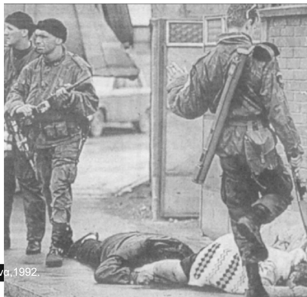
...και οι άντρες του. Εκκαθαρίσεις στη Μπιλεγίνα, 1992.