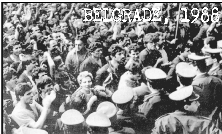
Απλήρωτοι εργάτες πολιορκούν το κοινοβούλιο.

Ήδη από τις πρώτες μέρες της επέμβασης τα στελέχη του υπουργείου εξωτερικών, κυρίως, αλλά και του υπουργείου ανάπτυξης, λιγότερο, έχουν λιώσει τις σόλες του σε ολόκληρη την βαλκανική και περισσότερο στην αλβανία και την μακεδονία. Κουβαλάνε μαζί τους μερικές πολύ δυσάρεστες αναλύσεις και μερικές πολύ ελκυστικές προτάσεις. Τόσο η αλβανία, όσο και η μακεδονία βρίσκονται - εξαιτίας της κρίσης- στον ίδιο προθάλαμο χειρουργείου που βρέθηκε προηγουμένως το κόσσοβο. Εξαιτίας της πολυεθνικότητάς τους, των ισχυρών αλτρωτισμών - δικών τους και των γειτόνων τους, των χιλιάδων προσφύγων (ο πληθυσμός της αλβανίας αυξήθηκε κατά 25% από τον Μάρτη), των ανίσχυρων κρατικών θεσμών, της αδυναμίας να αναπτύξουν από μόνες τους την οικονομία στη βάση της ελεύθερης πα-γκοσμιοποιημένης αγοράς, βάζουν υποψηφιότητα ως επόμενων κρατών που θα χρειαστούν αναδόμηση και φτιάξιμο από την αρχή. Αυτό είναι το κακό σενάριο που κομίζουν οι έλληνες α-ξιωματούχοι (αφήνοντας φυσικά να εννοηθεί ότι δεν είναι κάποιοι άλλοι που θα κάνουν την αναδόμηση, αλλά και η ίδια "πτωχή πλην όμως τίμια Ελλάδα" που θα συνδράμει). Η πρόταση που κάνουν, από την άλλη, έχει τον αέρα της δυναμικότητας και την πυγμή της μαφίας. "Η θα δώσουν το management της οικονομίας τους και θα πουλήσουν μερικούς στρατηγικούς τομείς ή το μαγαζί θα γίνει λαμπόγυαλο". Το οφέλος είναι