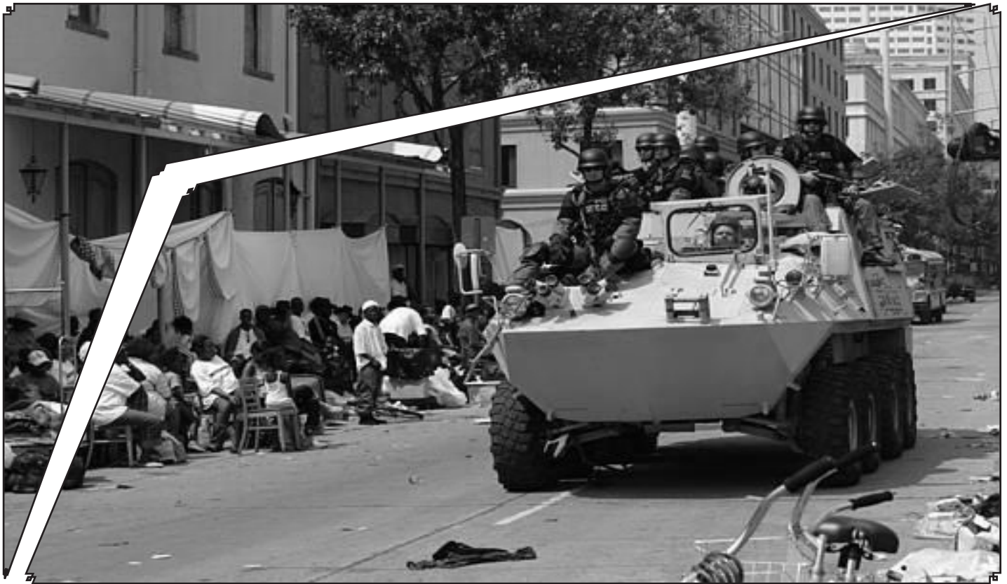
Ο στρατός καταστέλλει και περιπολεί τους δρόμους της Νότιας Καρολίνας αμέσως μετά τον τυφώνα Κατρίνα το 2005